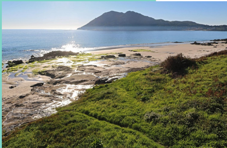
Praia da Bouga