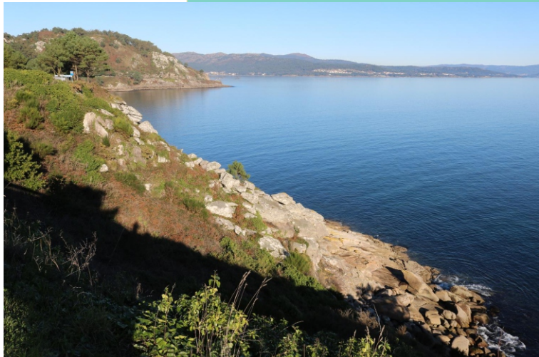
Cabo Rebordiño e enseada de Covas.