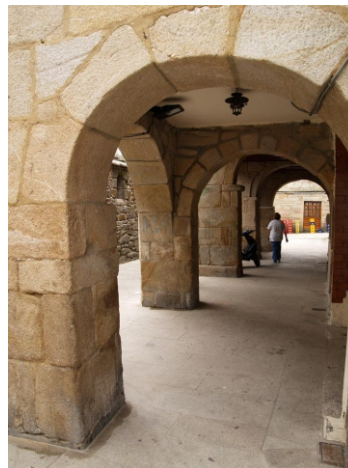
Rúas de Muros