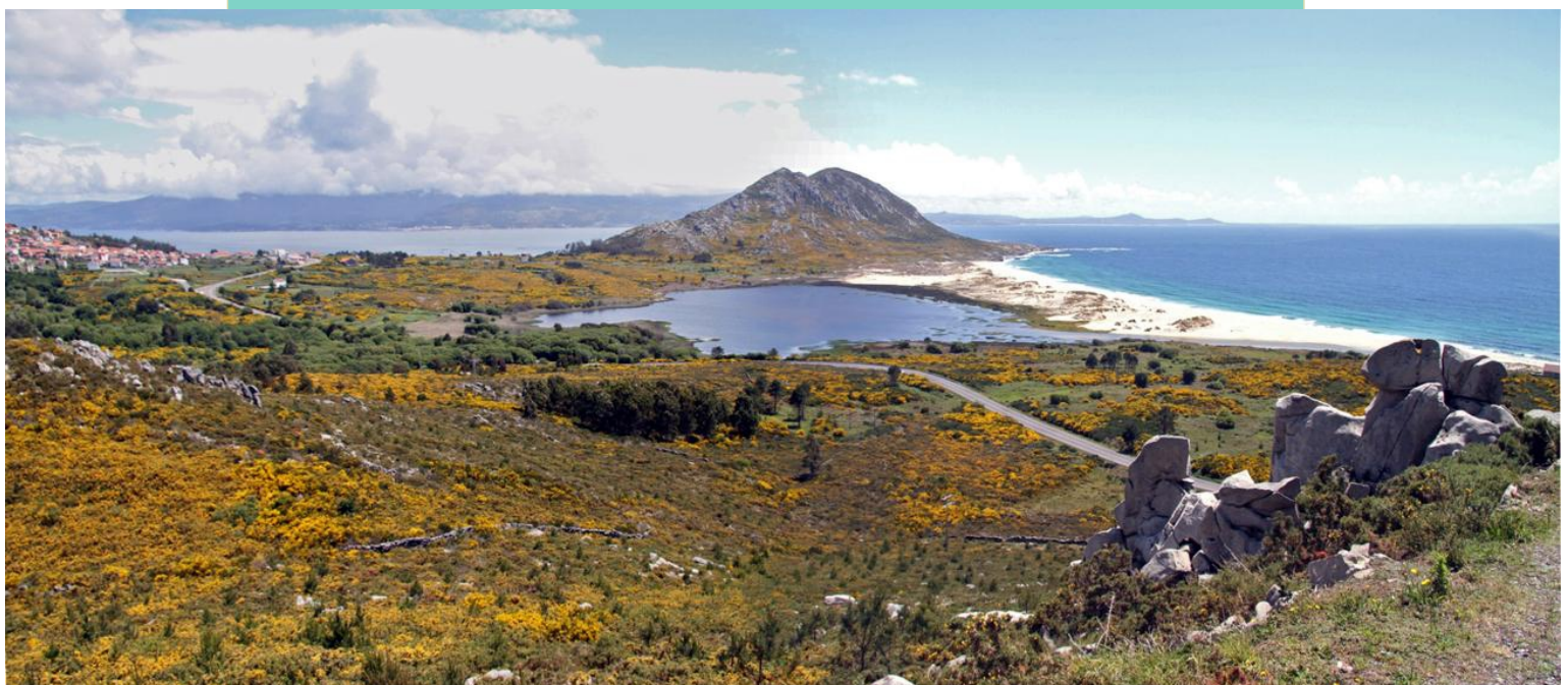
Lagoa das Xarfas, de auga doce e so ten comunicacióm co mar en temporais e épocas de mareas vivas. É unha importante zona de invernada de aves.