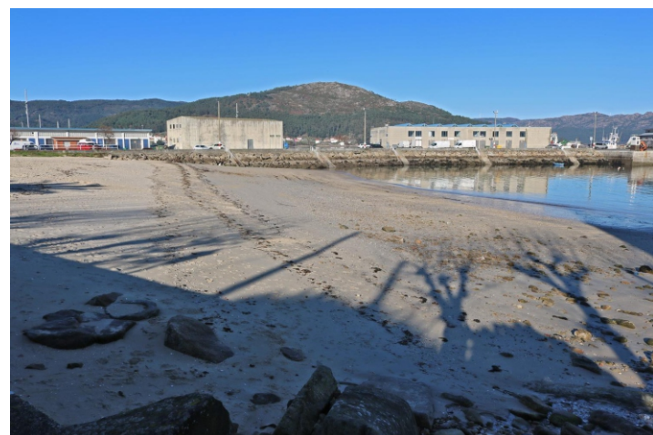
Praia do Castelo.