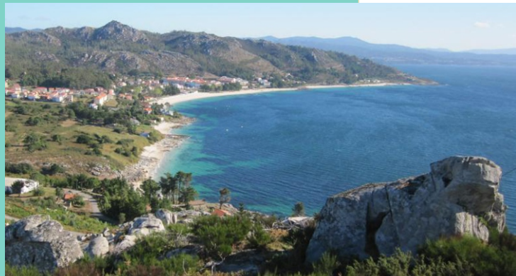
Punta Seixido e Praia de Fogareiro (vista desde Monte Louro). Ao fondo a praia de san Francisco e A Bouga.

Praia de San Francisco, con 760 m de lonxitude, e unha das máis concurridas da banda norte da Ría de Muros e Noia. De area branca e fina e abrigada. Esta zona era coñecida co nome de Lugar de Fomento, polas tres fábricas de salga que aquí estiveron instaladas. A continuación, cara a Monte Louro está a praia de Fogareiro, de 460 m de lonxitude, tamén moi abrigada e de area fina.