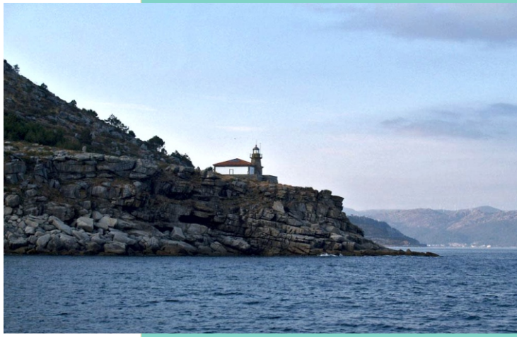
Faro de Monte Louro, na punta Queixal. Foi construído en 1862.