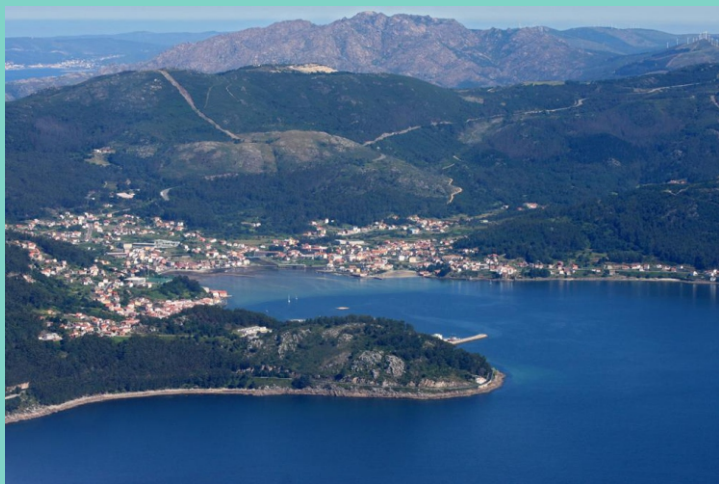
Enseada de Muroscos co Cabo Rebordiño no primeiro plano