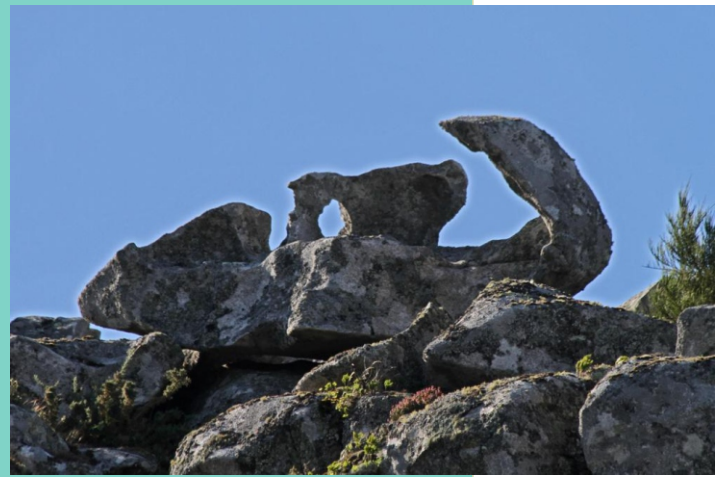
Unha das moitas rochas con formas curiosas que se poden atopar no Monte Louro