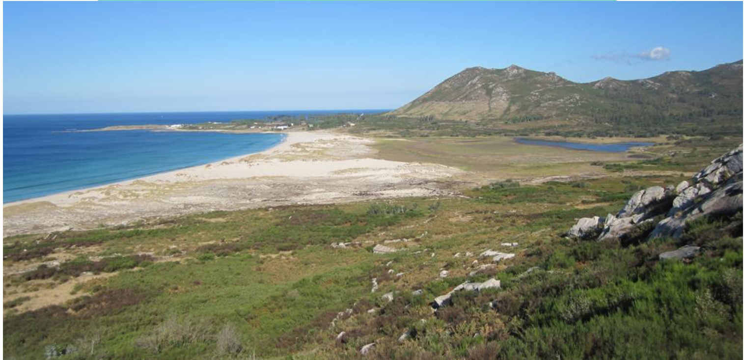
Praia de Area Maior, de Louro ou Arealonga, de 1.470 m de lonxitude e 50 m de largor medio. Está asentada sobre unha frecha que pecha case totalmente a desembocadura do rego Longarelo formando a lagoa das Xarfas. Conserva un bo sistema dunar.