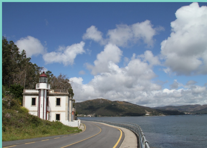
Faro do Cabo Rebordiño