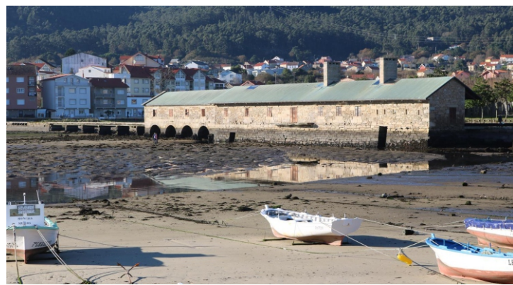
Muíño de Marea Acea do Cachón.